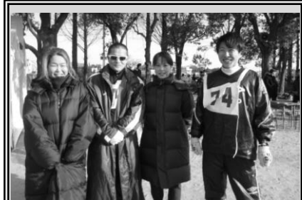
緑エントリーのチーム『麦わら』さんから一言

第 1 回の大会から家族で毎回参加しています。子どもが小さいころは子どもと参加していたのですが、社会人になって参加が難しくなった今は甥っ子姪っ子など親戚にも声をかけています。毎年参加していると、もはや我が家にはなくてはならないお正月の行事になっていますね。もちろんこれからも参加しますよ！ただ、参加希望者が増えて今は、先着順になっているようなので、エントリーに漏れないかが心配です。家族で参加できる行事をこれからも続けていってほしいと思っています。