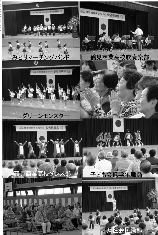
みどりマーチングバンド

また、今年にご参加いただいた皆様に「緑地域通用手形」が贈られました。これは、地域の登録店舗で「食事券」としてご使用いただけるという新しい取り組みです。運営委員会では、「今後もこの企画にご賛同いただける店舗数をさらに増やし地域の活性化につなげていきたい。」とのことでした。