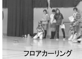
フロアカーリング